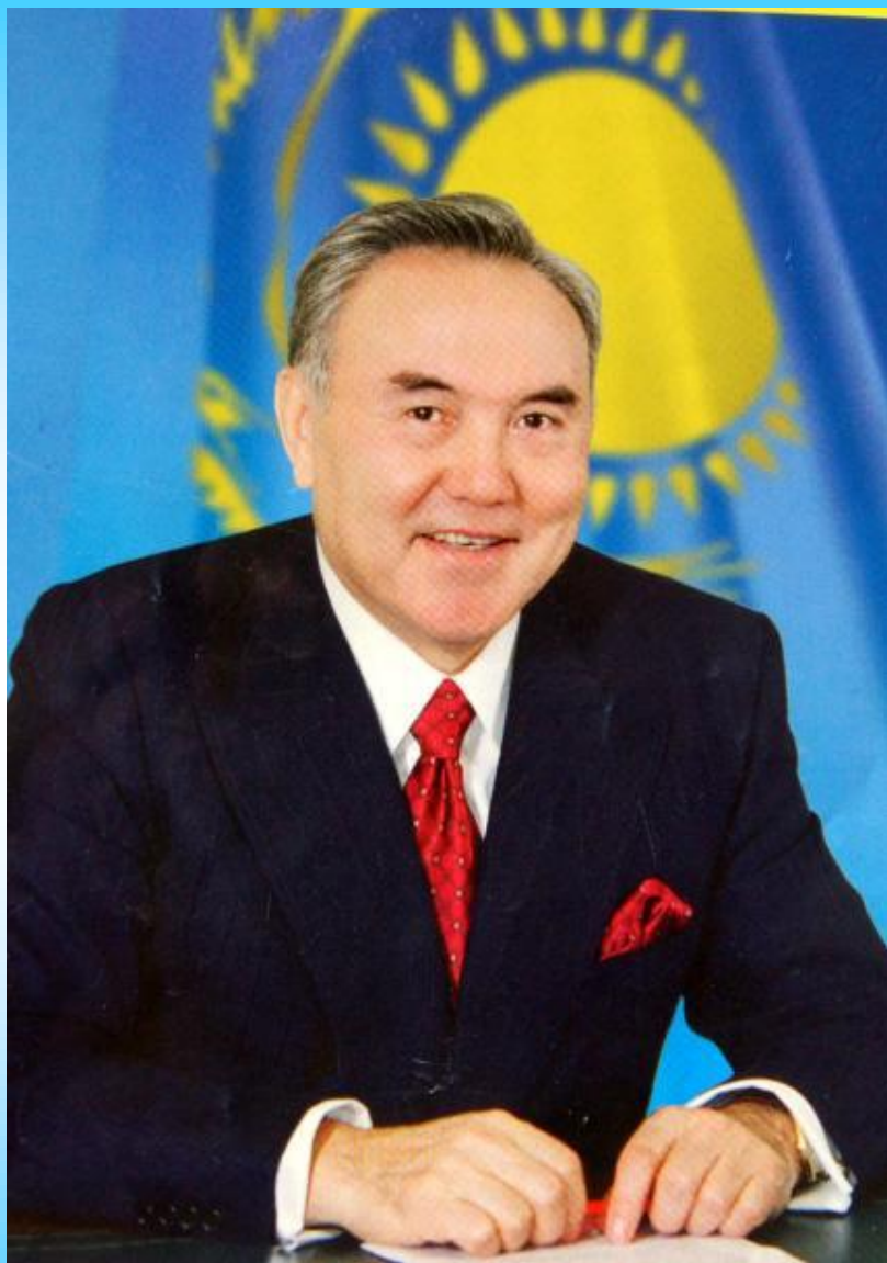
ҚР Президенті Н.Ә. Назарбаев